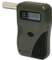
Alcohol Hawk® Elite