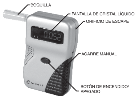
DIAGRAMA DE COMPONENTES